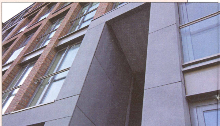
'Make-up' van complex Wilgenbosch, Dordrecht

Voor het aanbrengen van dit 3M™POLYTECH EC/UV-systeem is geen open vuur nodig. Ook op een nat dak hardt dit product uit. De leverancier Reppel BV uit Dordrecht garandeert een levensduur van vijftien jaar. De standaardkleur is grijs, maar een witte uitvoering is ook leverbaar.